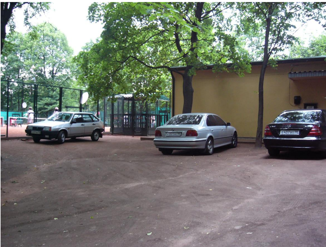
Автомобили в ожидании теннисистов...