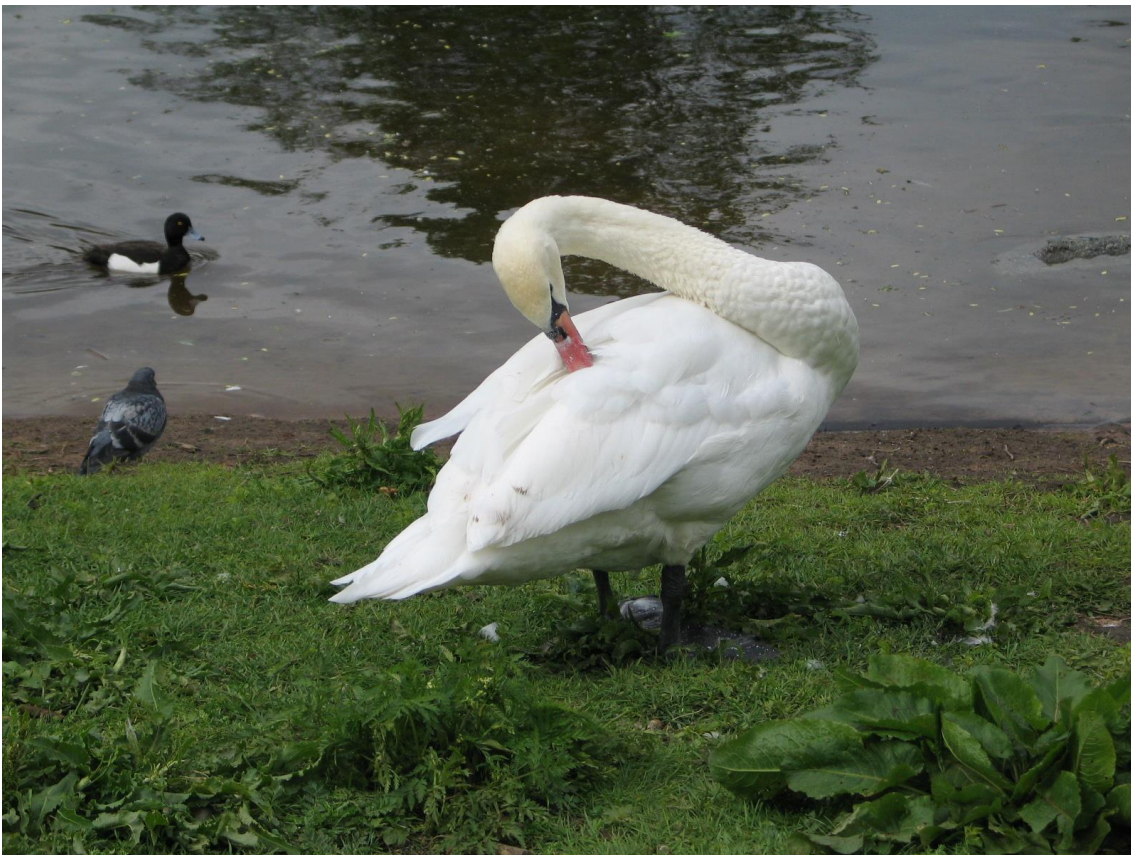
Этих прекрасных птиц чаще всего используют в качестве талисмана для парка