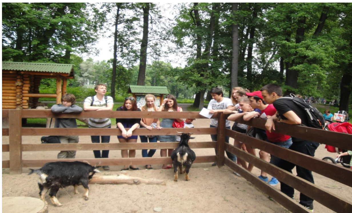
Животные мини зоопарка