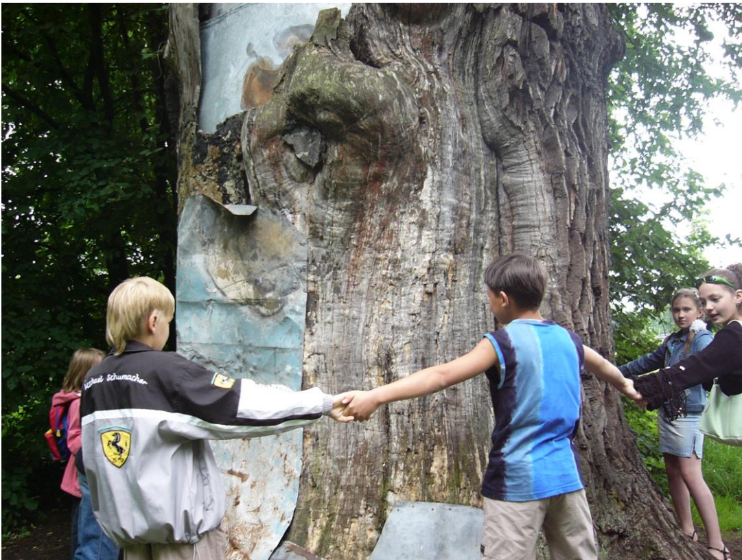
Деревья умирают стоя