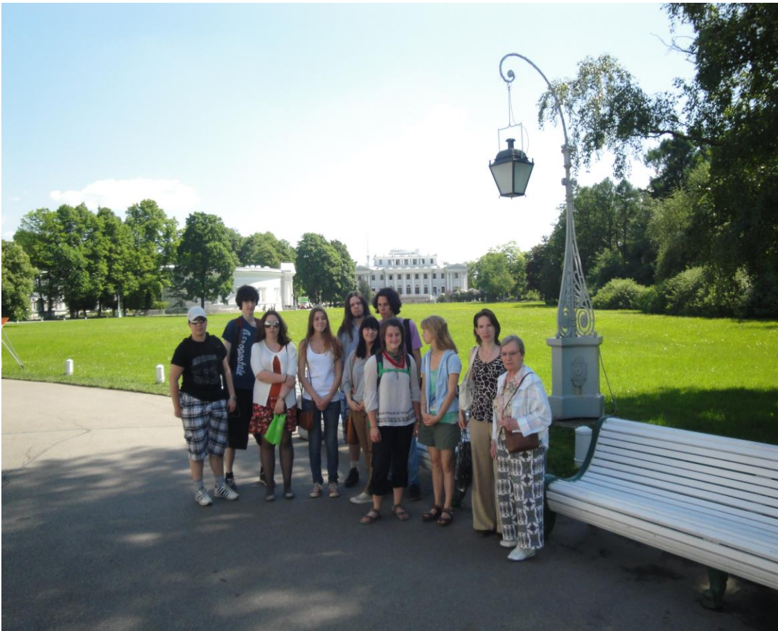
Вид на Масляный луг и Елагин дворец