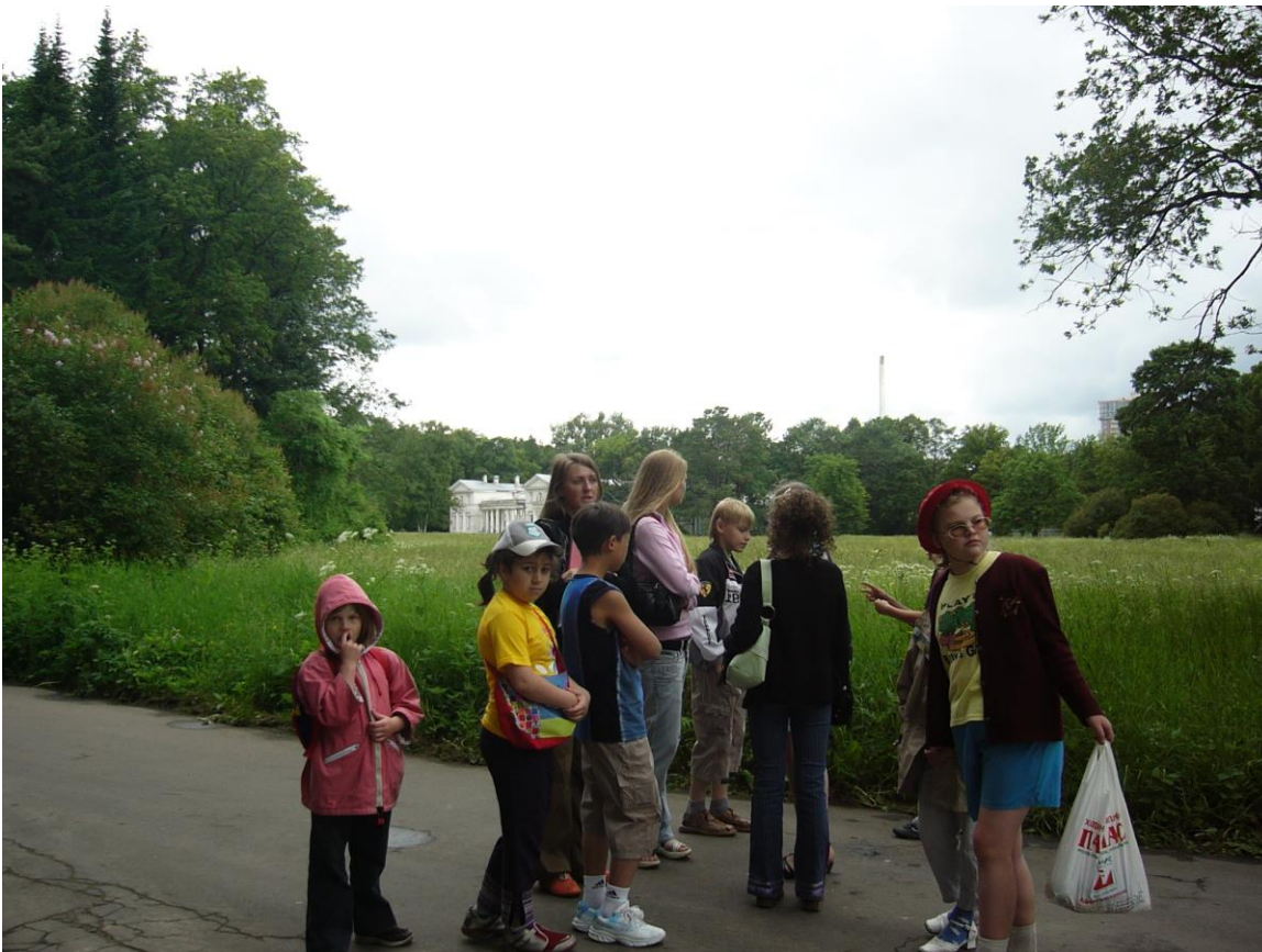
Масляный луг в самом расцвете